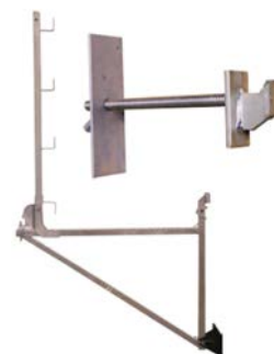
Ensemble de base Polyconsole®