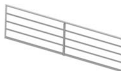
Rehausse barrière 3270 x 740 cm