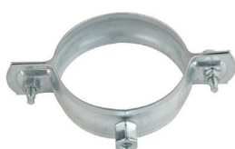
Collier à embase